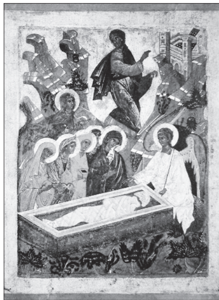
Жены-мироносицы. XVI век.

29 апреля — Святых жемироносиц: Марии Магдалины, Марии Клеоповой, Саломии, Иоанны, Марфы и Марии, Сусанны и иных; прав. Иосифа Аримафейского и Никодима.